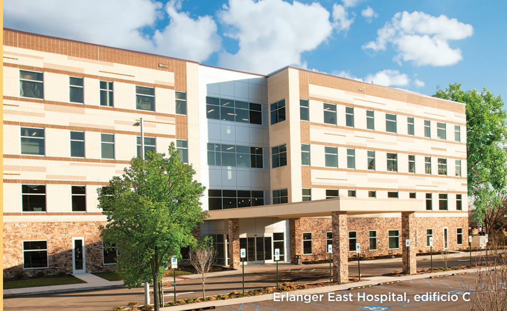
Erlanger East Hospital, edificio C